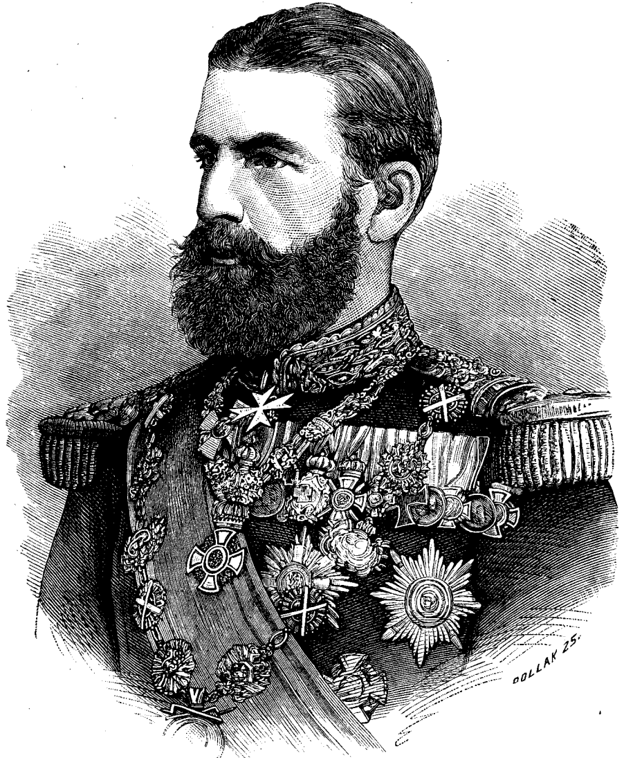
Carol I regele României.

gloria română, veți ceti acolo despre eroismul lui Mircea, Ștefan cel Mare și Mihaiu Vitezul: însé ori cât de mari și admirabile aû fost faptele lor, acele totuși nu puturá produce pentru țera lor un rezultat atât de