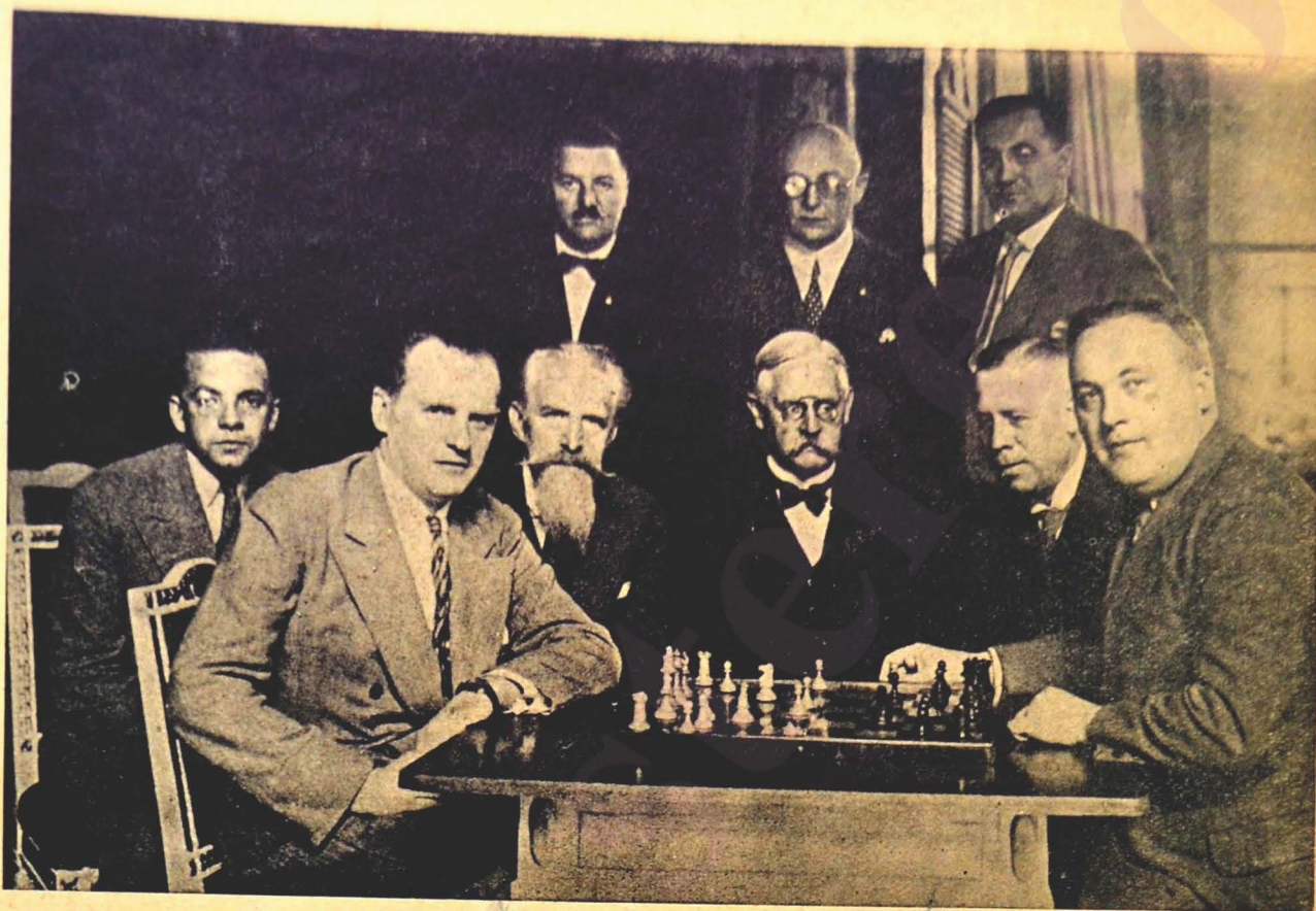
Șampionatul mondial de șah dela Wiesbaden. Matadorii Aljechin (stânga), și Bogoljubow (dreapta): ambii în primul plan.